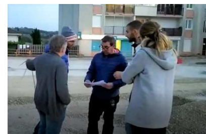
Photo prise avant le renforcement des mesures sanitaires

Depuis début octobre, la place du 19 mars a commencé sa mue. Entièrement repensée, elle deviendra un lieu convivial alliant à la fois parking, espace de verdure et aire de repos ou de jeu. Une halle couverte sera également implantée au centre de la place pour accueillir les manifestations festives de notre village. La place, qui sera constituée de 23 places de parking dont 2 pour personnes à mobilité réduite, devrait être livrée d'ici fin Novembre."