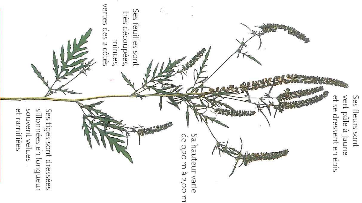
AMBROISIE EN FLEUR