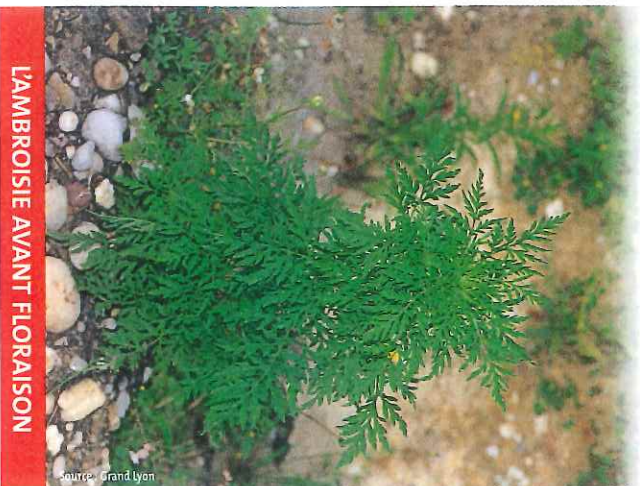
LAMBROISIE AVANT FLORAISON